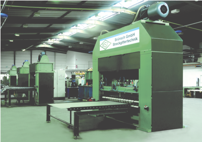
Jetzt neu: Streckgittermaschine Typ STG 2500/200